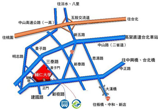
輔仁大學交通位置圖 2012.03修訂